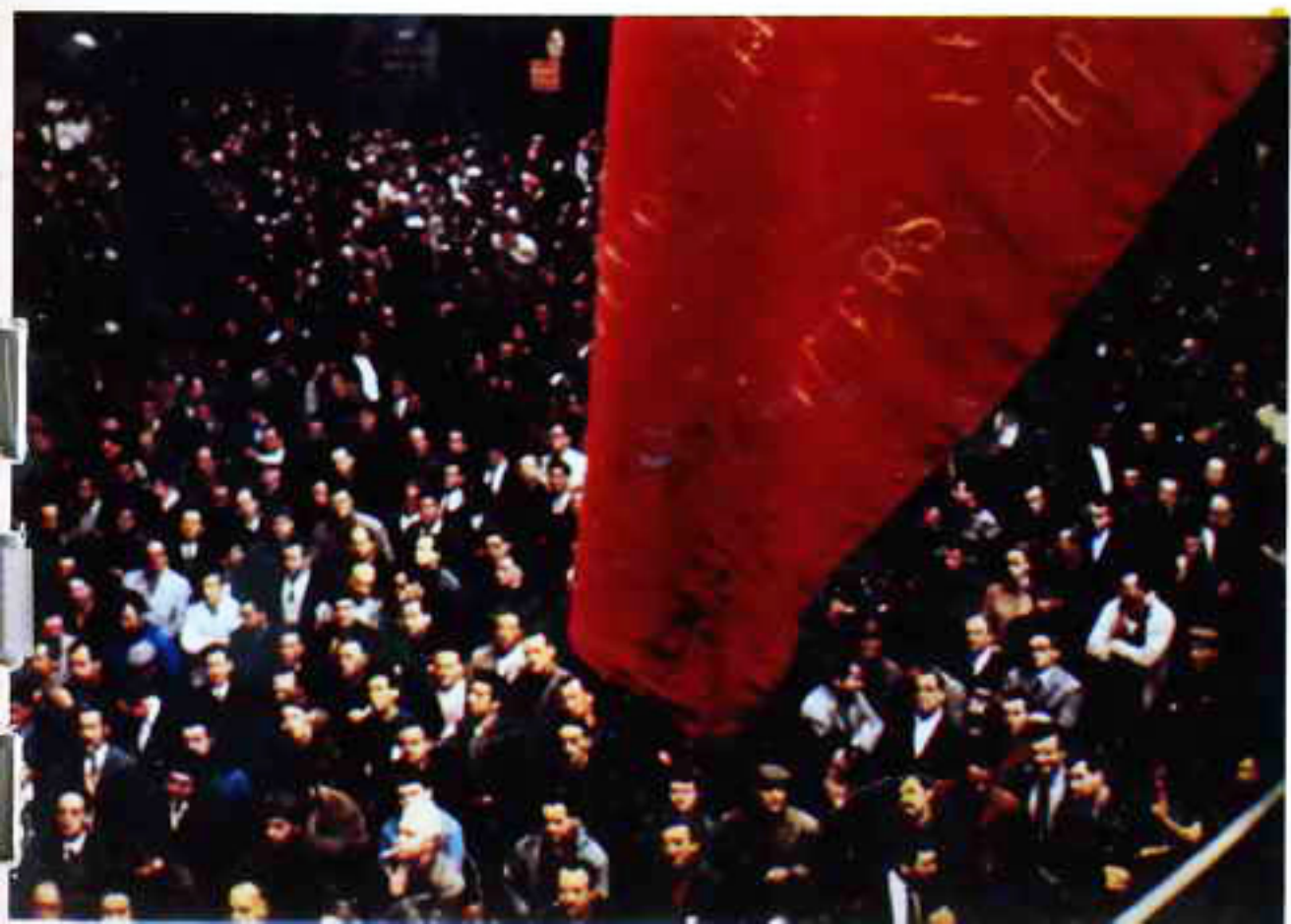
П а р и ж. (Принято по телевидению.)

Классический урок Парижской коммуны в первую очередь — это вывод о необходимости партии, которая вдохновлялась бы принципами марксизма-ленинизма, партии, которая вооружила бы учением Маркса, Энгельса, Ленина рабочий класс, широкие народные массы. Только пришедшие в движение массы, воодушевленные революционной теорией борьбы, а не действия маленьких групп могут открыть путь к социализму. Под водительством В. И. Ленина Октябрьская социалистическая революция 1917-го открыла новую эру в истории человечества. Парижские коммунары были отождествлены. Новый мир, провозвестницей которого была Парижская коммуна, уверенно смотрит в будущее. Благодаря усилению сотен миллионов благородные, человеческие мечты о братстве, осанявшие битвы и смерть героев Парижской коммуны, стали теперь реальностью на значительной части земли; они неизбежно станут реальностью и во всем мире. Поэтому, празднуя столетие Парижской коммуны и размышляя о том, и чему пришел сейчас последний версальцев и чего достигли наследники коммунаров, можно вместе с создателем «Интернационала» Эженем Потье сказать: «Коммуна не убита».